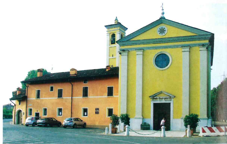
Die Wallfahrtskirche Santa Maria delle Stelle. Alle fünf Jahre wird hier ein großes Fest zur Erinnerung an eine Marienerscheinung im Jahre 1491 gefeiert.