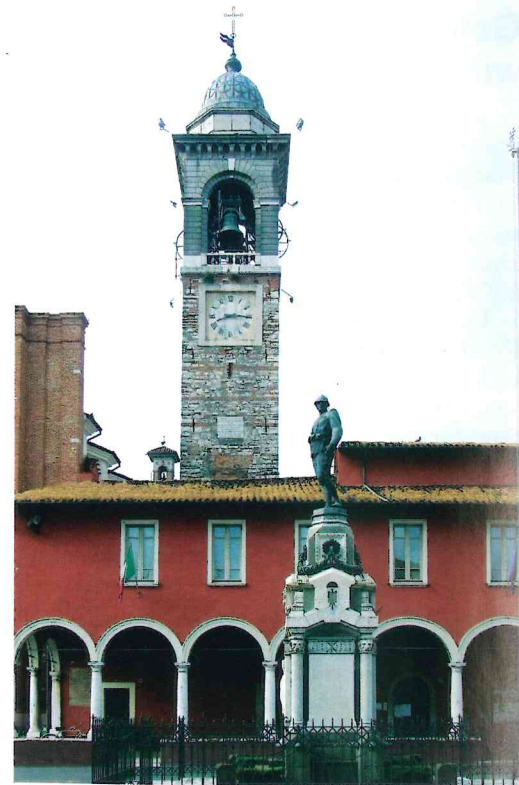
Der Palazzo Comunale, ein Bauwerk aus dem 16. Jahrhundert. Im Hintergrund der Turm der Basilica della Visitazione di Maria Vergine, die ebenfalls an die Erscheinung der Hl. Maria im Jahr 1491 erinnert.