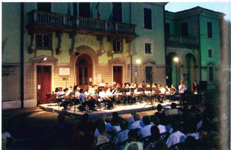
Das Akkordeonorchester von Bagnolo Mella spielt vor dem Palazzo Brunelli Bertazzoli, einem ehemaligen Patrizierhaus aus dem 17. Jahrhundert.