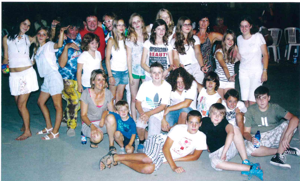
Stadtberger und Bagnolesi beim Abschlussfoto der Jugendbegegnung 2012

Längst haben freundschaftliche und familiäre Bande die rein offiziellen Kontakte zwischen beiden Städten abgelöst. Mit dem Partnerschaftsverein fahren die Stadtberger einmal im Jahr ihre Partnerstadt. Ebenso regelmäßig erwidern die Bagnolesi den Besuch, das von ihnen immer gerne aufgesucht wird. Oftmals werden sie in einer Gruppe von Kochschülern von der