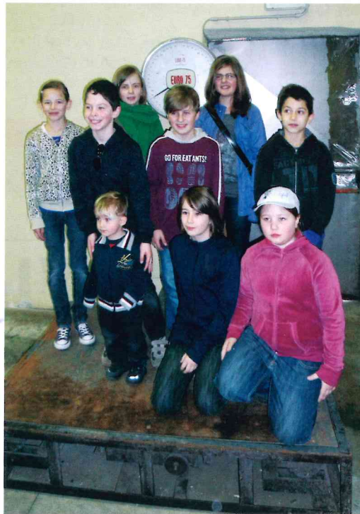
Auf der Käsewaage