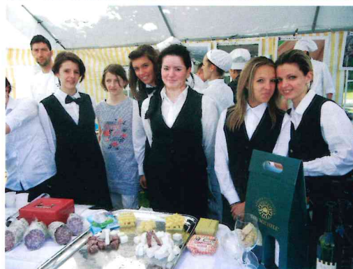
Die Kochschüler der Hotelfachschule CFP Canossa verwöhnen Stadtberger Gäste mit regionalen Spezialitäten

Hotelfachschule „CFP Canossa“ begleitet. Dann haben die Stadtberger auf dem Stadtfest am Stand des Partnerschaftsvereins Ge-