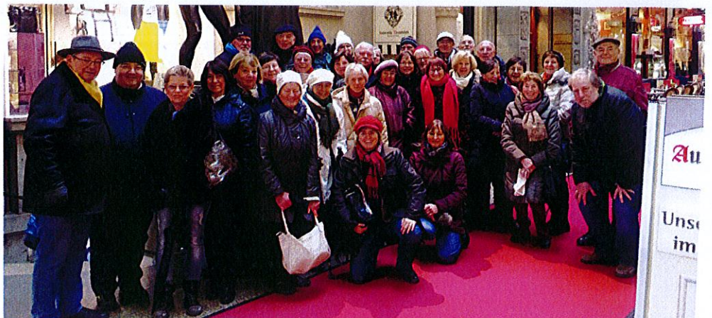
Gruppenfoto im Auerbachskeller