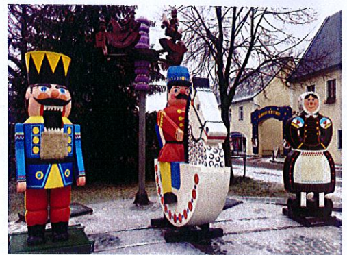
Nussknacker, Reiterlein und Pfefferkuchenfrau Wahrzeichen von Olbernhau