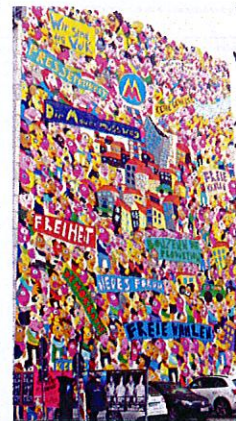
Mauerbild zur Erinnerung an die friedliche Revolution 1989