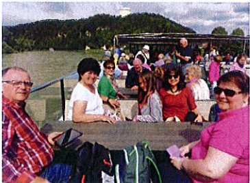
Donau-Schiffahrt ab Kelheim

Mit dem Schiff ging es von Kelheim durch den Donaudurchbruch mit seiner einzigartigen Felslandschaft zum Kloster Weltenburg, wo auch das Mittagessen eingenommen wurde.