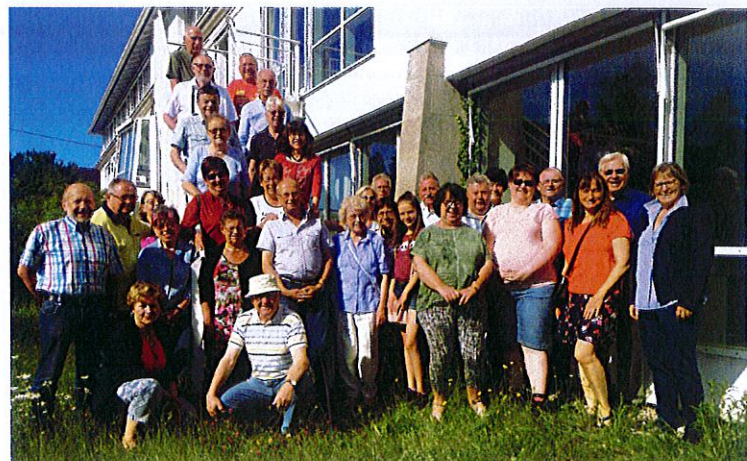
Auf Wiedersehen bis zum nächsten Stadtberger Stadtfest