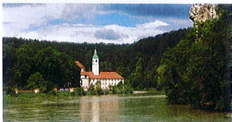
Nach dem Donaudurchbruch erreicht der PaVe Kloster Weltenburg