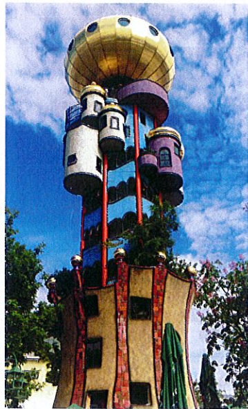
Abensberg, am Ende der Führung erwartet den PaVe der Aufstieg auf den berühmten Hundertwasserturm

Anschließend stand ein Besuch in Abensberg auf dem Programm, wo eine Brauereiführung bei der Kuchlbauer-Brauerei – mit Besichtigung des bekannten Hundertwasserturms und anschließender Brotzeit anstand.