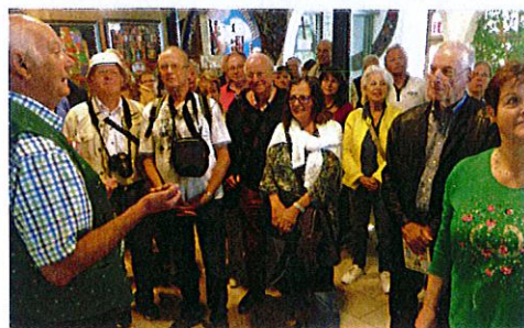
Führung durch die Weissbier Brauerei in Abensberg