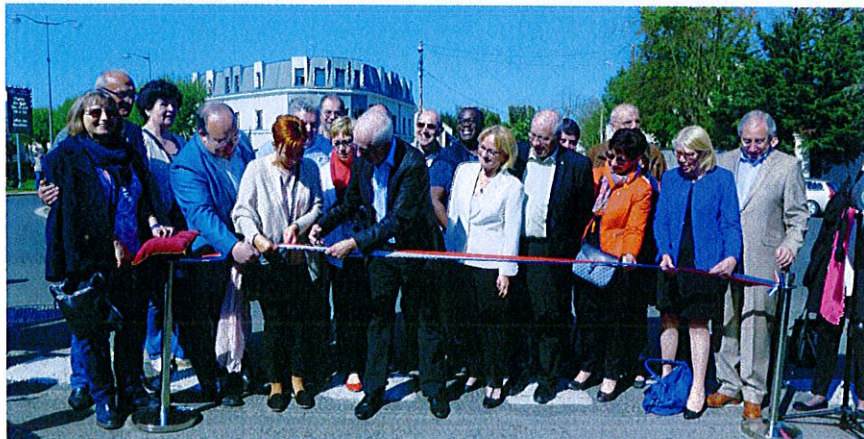
Einweihung des Kreisverkehr der Brüderlichkeit mit den Bürgermeistern und Verantwortlichen aus 4 Nationen