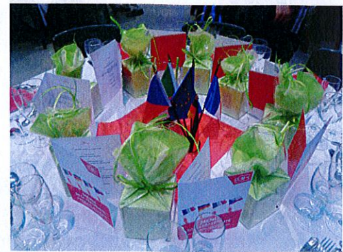
Festabend, feierliche Tischdekoration

Das 5-gängige Festmenü schmeckte vorzüglich und die Bands „Los Celticos“ und „Les Vinyls“ sorgten für beste Unterhaltung. Viele ließen es sich nicht nehmen, schon zwischen den Gängen das Tanzbein zu schwingen. Zum Dessert gas es für jede Partnerstadt eine eigens kreierte Geburtstagstorte. Gegen Mit-