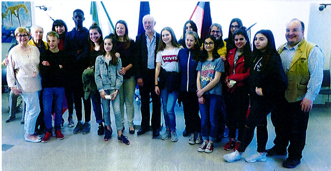
Bienvenue für die deutsch-französische Jugend im Rathaus in Brie-Comte-Robert

Noch immer ganz beeindruckt vom Festprogramm und der Herzlichkeit der französischen Gastgeber ging es am Dienstag mit einem Zwischenstopp in Metz unter dem Motto „mit Metz in Metz“ nach Hause – mit einem „au revoir“ bis zur 30-Jahr-Feier in Stadtbergen im Frühjahr 2018.