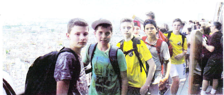
Toller Blick vom Eiffelturm