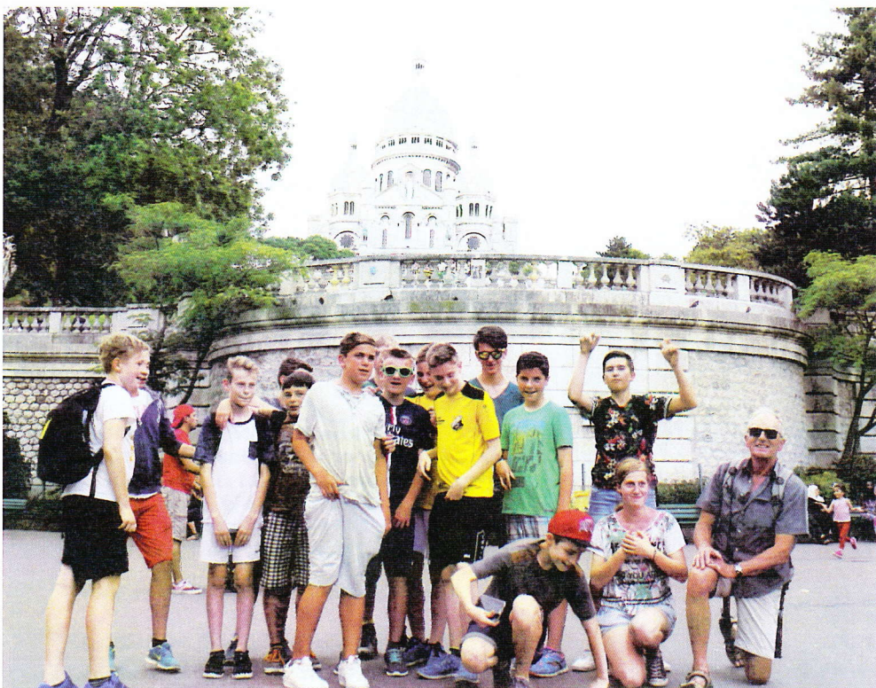
Am Montmartre, vor Sacré Coeur