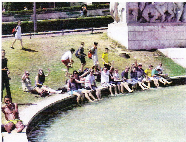
Plantschen im Trocadero-Brunnen