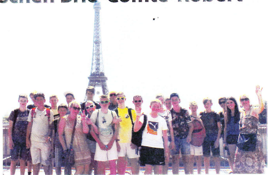
Vor dem Eiffelturm