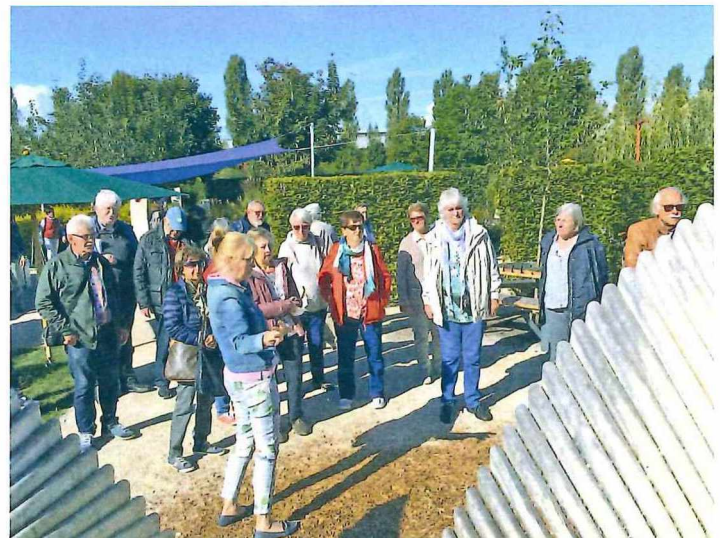
Der PaVe vor einer Spielskulptur aus Holz in Form einer Doppelhelix