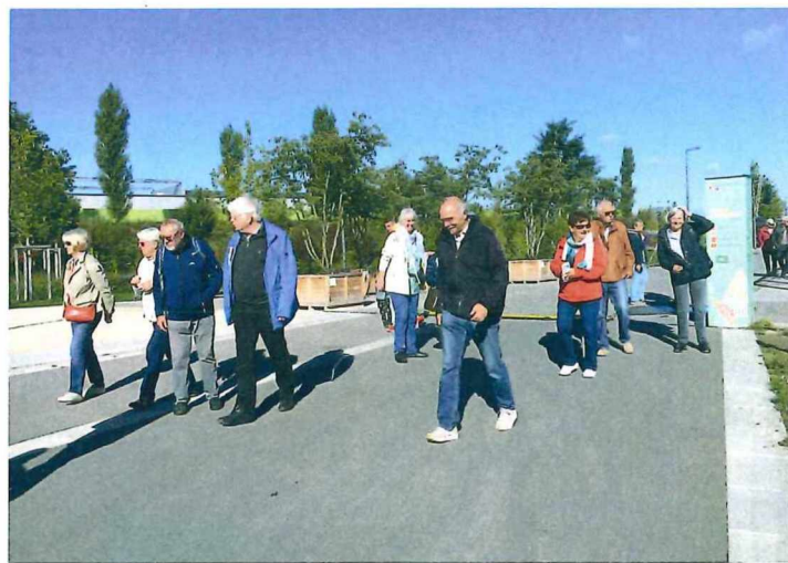
Spaziergang an den neu angelegten Wassergärten entlang