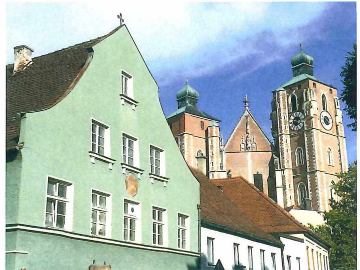
Altstadtgassen in Ingolstadt und Liebfrauenmünster