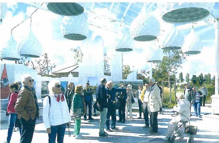
Der PaVe in Moskau, auch Ingolstadts Partnerstädte sind vertreten