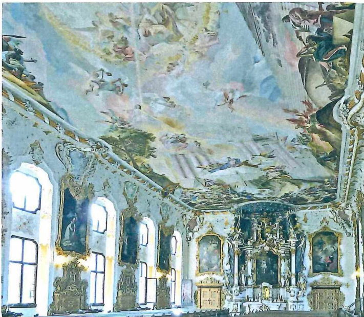
Ingolstadt, Asamkirche St. Maria de Victoria