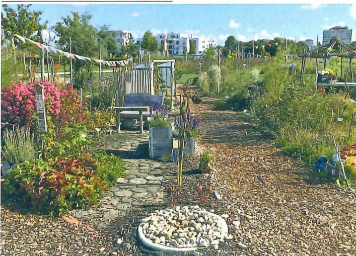
Creative Ideen für Nutzgärten