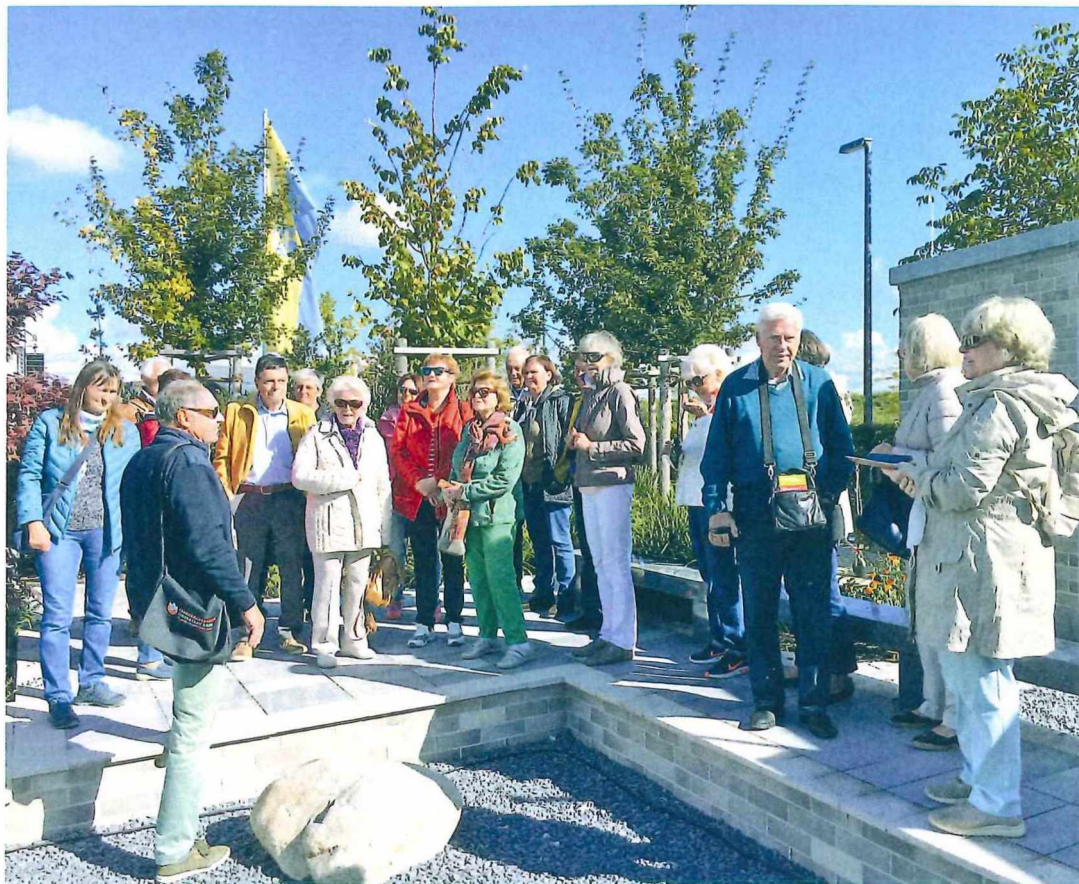
In Ingolstadts chinesischer Partnerstadt Foshan