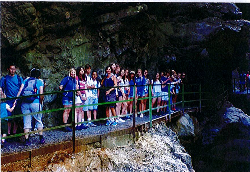
Stadtberger und Französische Jugendliche in der Breitachklamm