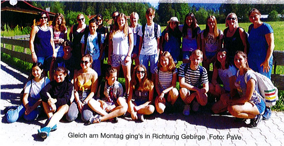
Gleich am Montag ging's in Richtung Gebirge

Informationen und Anmeldeformulare zu allen Veranstaltungen und Fahrten des PaVe, sowie allgemeine Informationen zu den drei Städtepartnerschaften der Stadt Stadtbergen und/oder zu den Programmen für Erwachsene und Jugendliche des Partnerschaftsvereins Stadtbergen e.V., gibt es immer zeitnah auf der Homepage www.pave-stadtbergen.de , beim Vorstand unter Mail pave@stadtbergen.bayern.de , an der Rathaus-Infothek oder unter Telefon 0821 / 24 38 - 164.