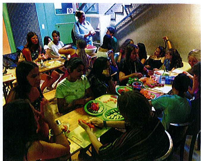
Für den Abschlussabend bereiten alle gemeinsam eine bayrische Brotzeit zu