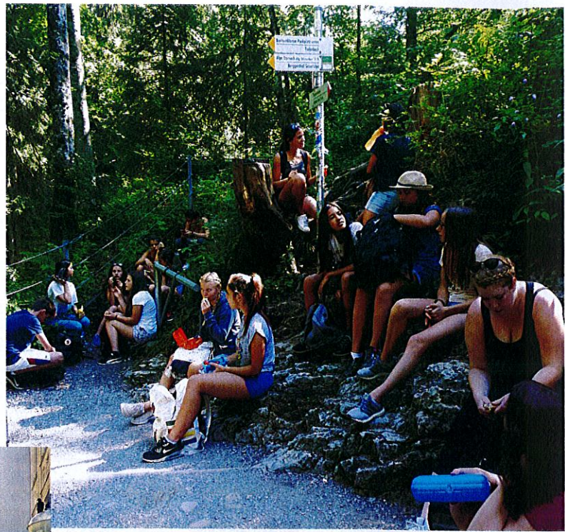
Nach der Wanderung eine wohlverdiente Brotzeit