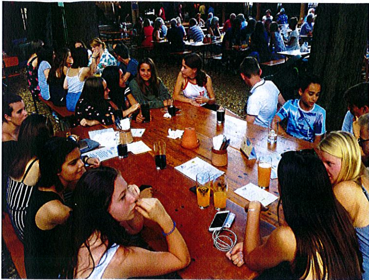
Ein großes Hallo gab's zum Auftakt der Jugendwoche im Biergarten Fuchs