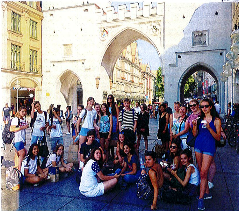
Vor dem Karlstor nach einem tollen Tag in München