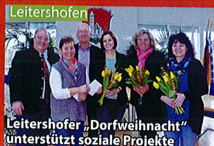
Leitershofener „Dorfweihnacht“ unterstützt soziale Projekte