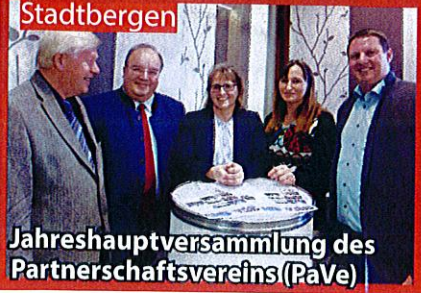
Jahreshauptversammlung des Partnerschaftsvereins (PaVe)