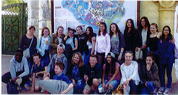
Deutsch-französische Jugend im Parc Astérix, in 2018 geht es zum Beispiel ins Disneyland Paris

haben gezeigt, dass dies die beste Möglichkeit ist, die Lebensweise des Gastlandes kennenzulernen. Auch diese Fahrt wird voraussichtlich wieder vom deutsch-französischen Jugendwerk (dfjw) und den Partnervereinen gefördert, so dass die Woche mit Anreise, Programm und Unterbringung circa 250,- € pro Teilnehmer kostet. Der Gegenbesuch der französischen