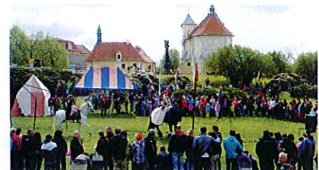
Historisches Waldsteinfest im tschechischen Litvinov

Informationen und Anmeldeformulare zu allen Fahrten des PaVe sowie allgemeine Informationen zu den drei Städtepartnerschaften der Stadt Stadtbergen und/oder zu den Programmen für Erwachsene und Jugendliche des Partnerschaftsvereins Stadtbergen e.V. gibt es auf der Homepage pave-stadtbergen.de , beim Vorstand unter Mail pave@stadtbergen.bayern.de , an der Rat-