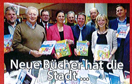
Neue Bücher hat die Stadt ...