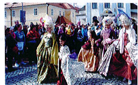
Großer Festumzug beim historischen Waldsteinfest im tschechischen Litvinov, Foto Stadt Litvinov.tif