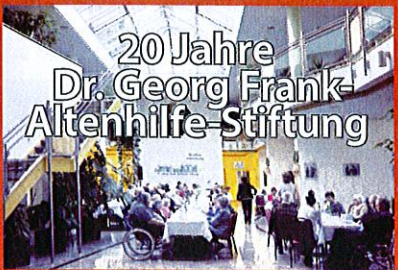
20 Jahre Dr. Georg Frank-Altenhilfe-Stiftung