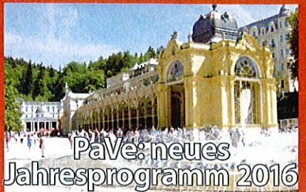
PaVe: neues Jahresprogramm 2016