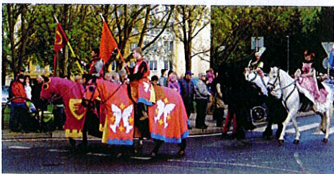
Großer Festumzug beim historischen Waldsteinfest im tschechischen Litvínov