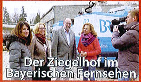
Der Ziegelhof im Bayerischen Fernsehen

klimaneutral natureoffice.com | DE-077-561231 gedruckt