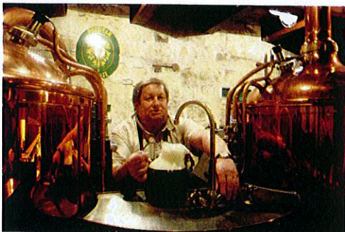
Na zdraví, prosit in Žatec