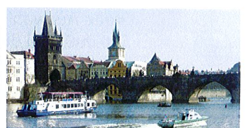
Goldene Stadt Prag mit Karlsbrücke und Moldau