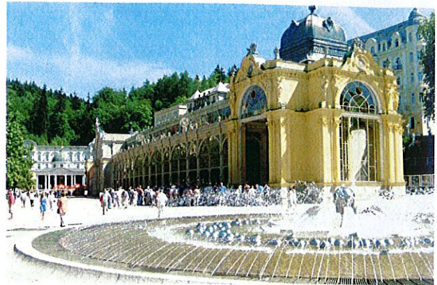
Marienbad, Trinkhalle und singende Fontäne

Schnell anmelden sollte man sich auch für die Fahrt ins italienische Bagnolo Mella vom Donnerstag, 7. bis Sonntag, 13. 7. 2016 . Höhepunkt dieser Reise ist der Besuch von Verona und der Oper "La Traviata" in der weltberühmten Arena. Weiter steht zum Beispiel am Freitag ein Mittagessen im prämierten Bilderbuchdorf Castellara Lugasello im südlichen Hinterland