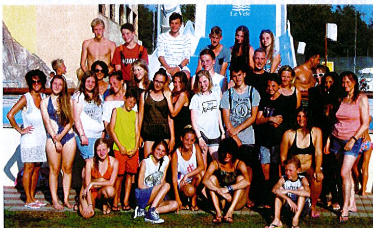
Baden im Aquapark