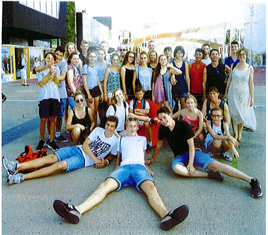
Treff bei der EXPO

Am Montag startete das umfangreiche Wochenprogramm mit einer Raftingtour auf dem Fluss Adda. Alle hatten großen Spaß und das Baden kam bei den hochsommerlichen Temperaturen auch nicht zu kurz. Die größte Herausforderung bestand darin, wieder in die dicken Schlauchboote zu klettern, letztendlich wurden aber alle wieder „gerettet“. Frisch gestärkt nach einem Picknick ging es in ein Elektrizitätswerk und anschließend in die alte Industriestadt und Unesco Welterbestätte Crespino. Den Abend verbrachten alle in ihren Gastfamilien. Der Freizeitpark Gardaland stand am Dienstag auf dem Programm. Bis spät in Abend hinein konnte jeder