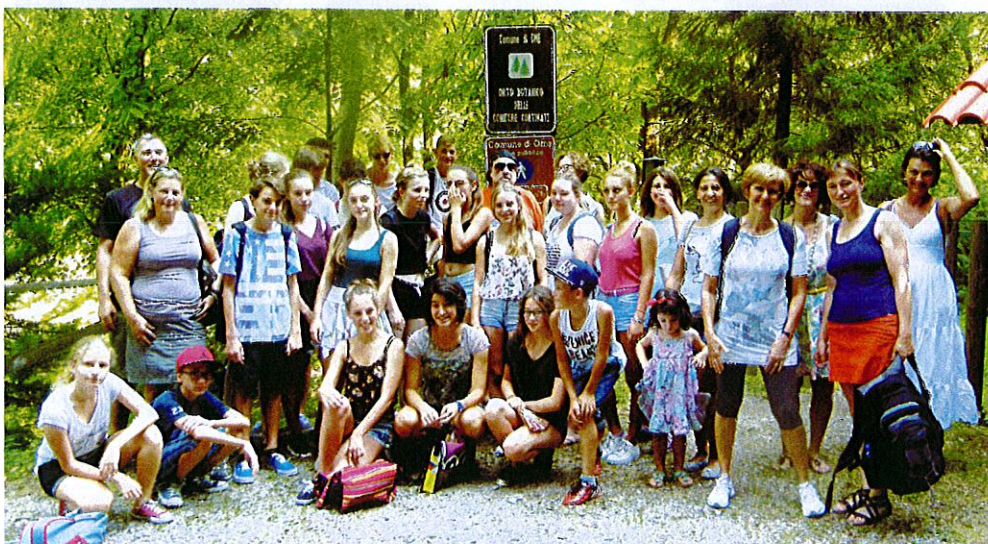
Ormeo Botanischer Garten

Bereits um 8 Uhr startete die deutsch-italienische Gruppe am Donnerstag zur EXPO in Mailand. Mehr als 154 Länder stellen in den unterschiedlich gestalteten Pavillons ihr Land rund um das Thema „den Planet ernähren / Energie für das Leben“ vor. Gegen 22 Uhr traf