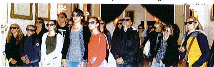
Im 4D-Kino der Bavaria Filmstudios in München