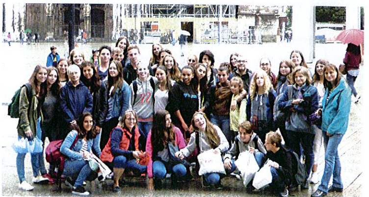
Vor dem Ulmer Münster