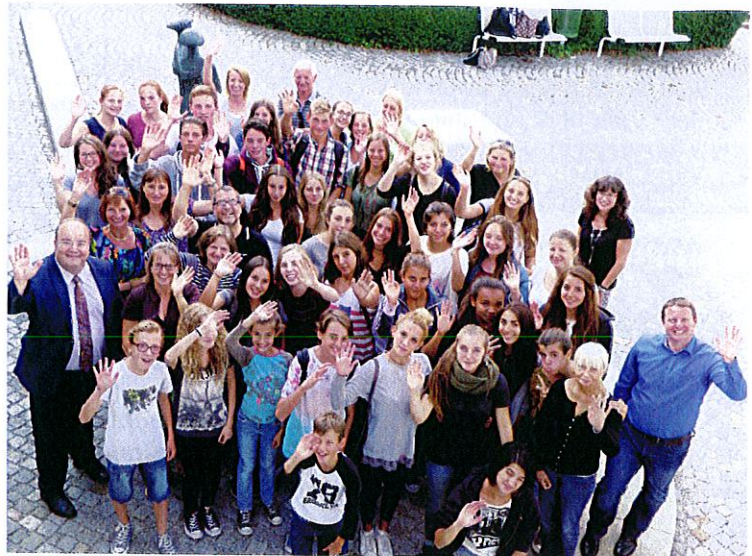
internationale Gruppe nach Bürgermeisterempfang im Rathaus