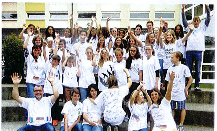
Jeder in seinem T-Shirt der internationalen Stadtberger Jugendwoche