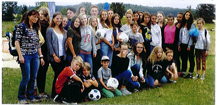
Alle Nationalitäten beim Fußball-Golf in Rehling